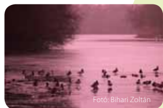
Fotó: Bihari Zoltán